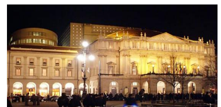
Théâtre La Scala - Extérieur