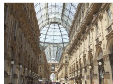
Galerie Vittorio Emmanuele II