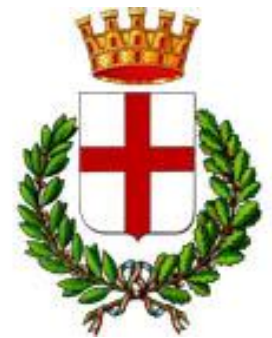
Ville de Milan

Milan, capitale de la mode et du design, du savoir-faire italien, détient 30 % des dépôts de brevets nationaux . La ville est également organisatrice de l'Exposition Universelle de 2015 .