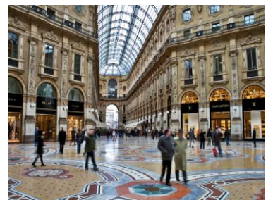
Galerie Vittorio Emmanuele II