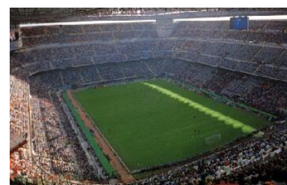
Stade San Siro