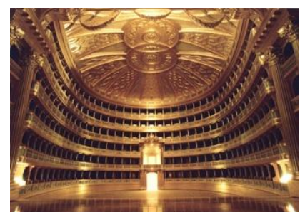
Théâtre La Scala - Intérieur