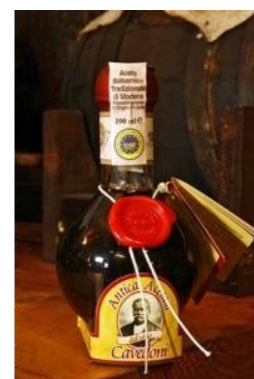
Vinaigre balsamique de Modène