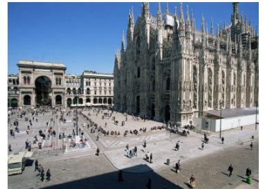
Place El Duomo