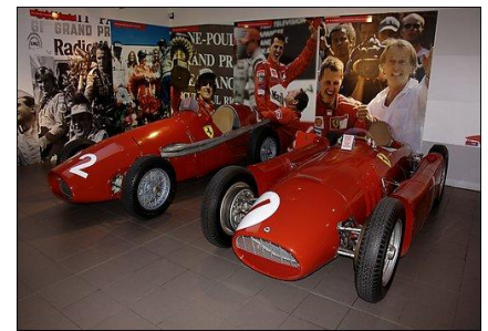
Collection du Musée Ferrari