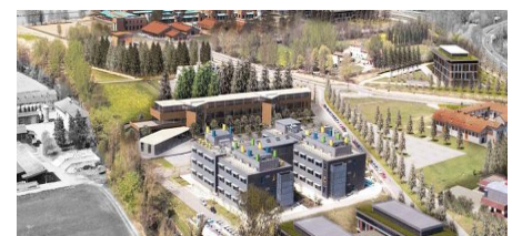
Complexe Parco Tecnologico Padano

Parco Tecnologico Padano La ricerca si fa impresa Entrepreneurial research in ag-biotech