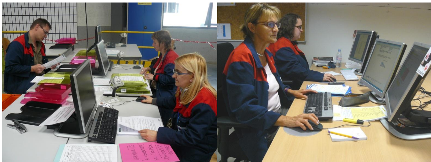
Traitement numérique des dossiers clients à l'aide d'outils de Gestion électronique de documents.