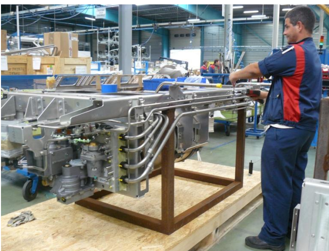
Assemblage de charpente équipée – Haute vitesse ferroviaire

L'évolution est évidente et les chiffres en témoignent. En 2011, il représentait 42% du CA contre 34.5 % en 2008. Un développement dû au travail des équipes commerciale, industrialisation et production de Bretagne Ateliers en termes de diversification. Ce pourcentage devrait être porté à 60 % en 2014 avec notamment le développement de l'activité pour le client ALSTOM de la Rochelle, le contrat de maintenance d'amortisseurs avec la SNCF mis en place en septembre 2012 et l'arrivée d'activités dans le secteur aéronautique.