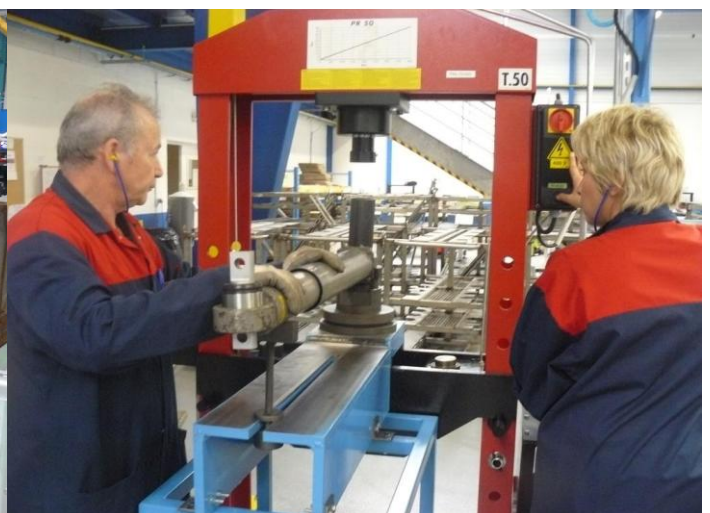
Reconstruction d'équipements pneumatiques, hydrauliques et électriques