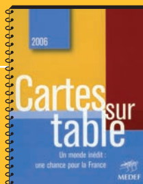
offert à chaque participant