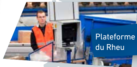
Plateforme colis du Rheu

L'agence "La Banque Postale Chez Soi" au Centre financier de Rennes offre une relation privilégiée à distance ; une vraie banque multicanale : mail, messagerie instantanée, téléphone, visioconférence... de multiples modes pour entrer en relation avec des conseillers bancaires.