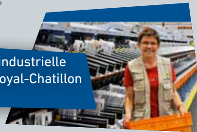
Plateforme industrielle courrier à Noyal-Chatillon sur Seiche

Labellisée HQE®, la plate-forme industrielle Courrier Rennes Armorique traite l'ensemble du courrier d'Ille-et-Vilaine, des Côtes d'Armor de la Mayenne et du Morbihan. Avec ses machines de dernière génération, elle est la plate-forme la plus moderne de l'Ouest.