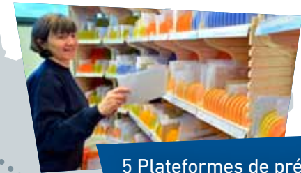
5 Plateformes de préparation et/ou distribution du courrier