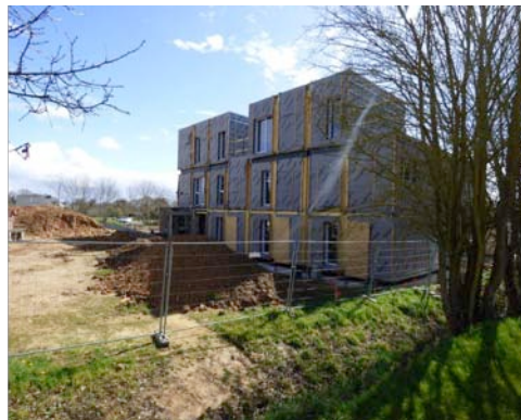
Le collectif de maisons containers à la Chapelle-Thouarault

Venue des Pays-Bas, le Groupe Lamotte s'est réapproprié une véritable innovation technique : utiliser des containers maritimes peu coûteux, résistants et légers pour en faire des logements . Ce pari d'assembler des containers pour en faire un ensemble locatif répond parfaitement aux contraintes actuelles : à seulement 1500e le m 2 , il facilite l'accès à la propriété des ménages modestes . Sa construction ne requiert pas de terrassement lourd et respecte ainsi l'environnement . De même, ses performances thermiques sont en deçà des exigences du THPE et conformes aux nouvelles réglementations qui se profilent à l'horizon 2020 (BEPOS). Autant de qualités qui font des maisons containers une solution de choix pour le logement de demain.