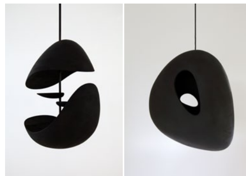
8 Odile Decq ATOM Iroko, teinté noir Dimensions variables