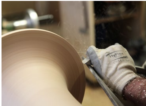
1 La Tournerie du Plat d'Or Jérémy Larcher