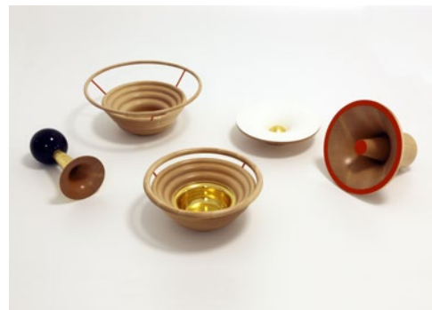
4 Matali Crasset Infrasons Sycomore, laque, feuille d'or Dimensions variables