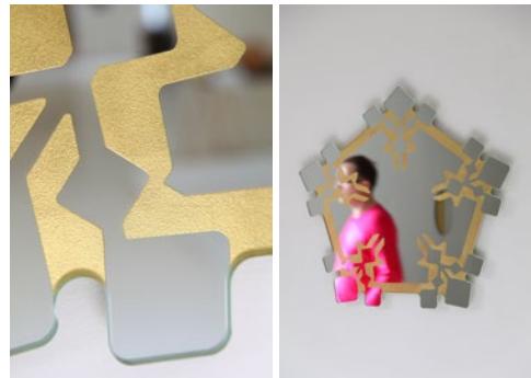
6 Matali Crasset Devant moi Miroir, feuille d'or L.67 x h.69,5 cm