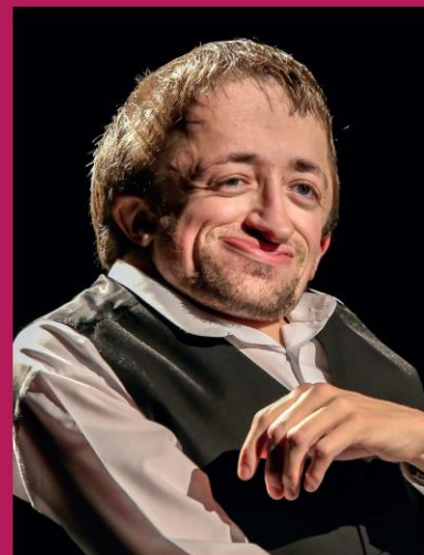
L'humoriste Guillaume Bats pour un extrait de son One Man Show

Programme et invitation gratuite à télécharger sur le site www.ladapt.net