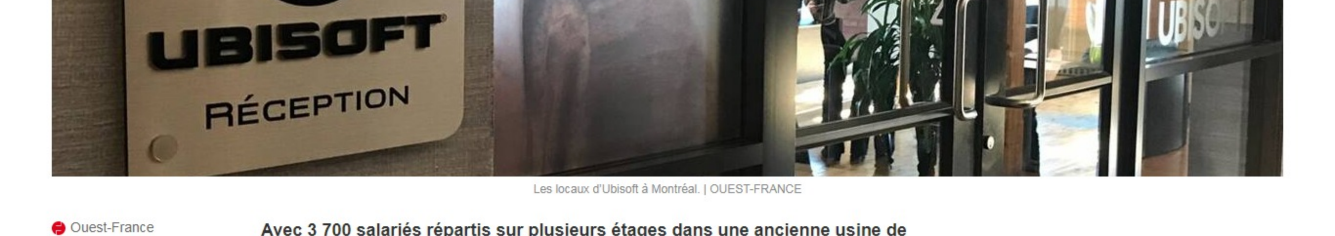
Les locaux d'Ubisoft à Montréal.