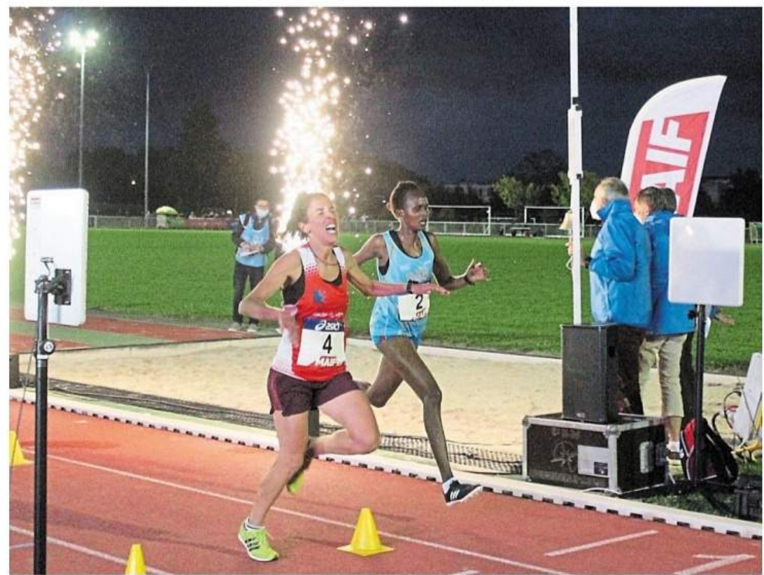
Les finish du 10 000 m sont souvent spectaculaires.